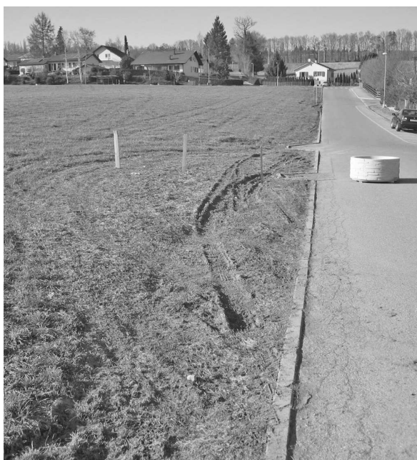
La route du Madelain