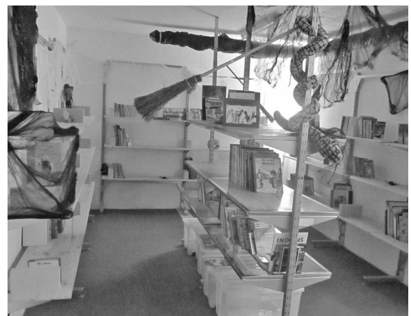
La nouvelle bibliothèque de l'école