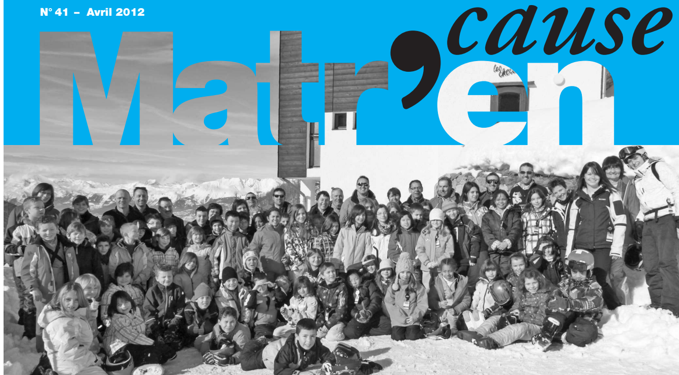
Les participants au camp de ski 2012 à Chandolin/St-Luc VS