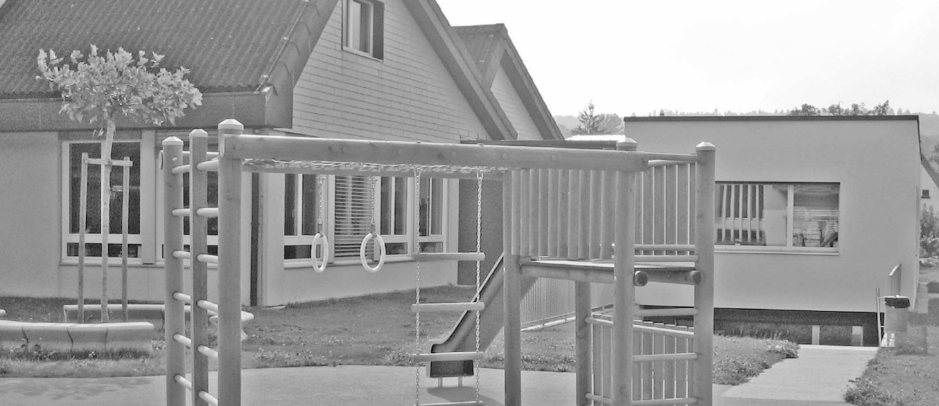
Sur la droite de l'image, le bâtiment de l'accueil extrascolaire de Matran