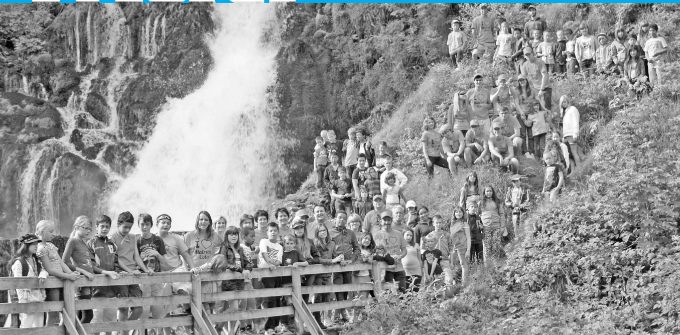
Les participants de la colonie 2012