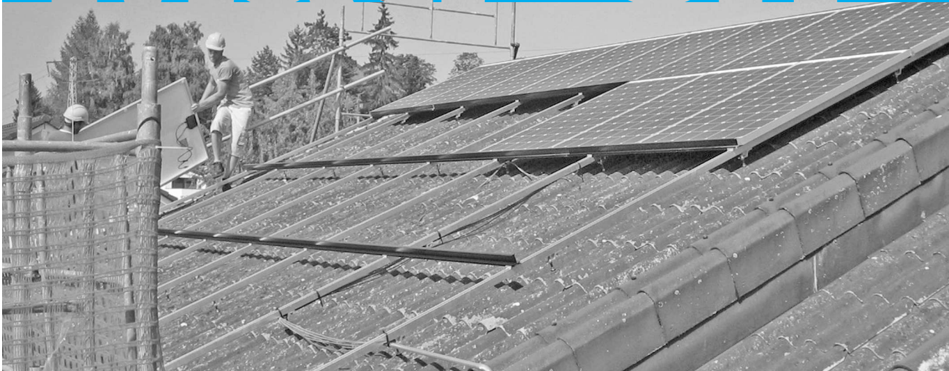
Pose des panneaux photovoltaïques sur le toit de l'école au mois d'août 2012