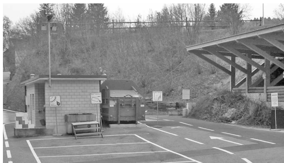
La déchetterie de Matran