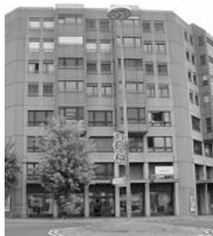
Le bâtiment de l'ORP Fribourg, Rte des Arsenaux 15