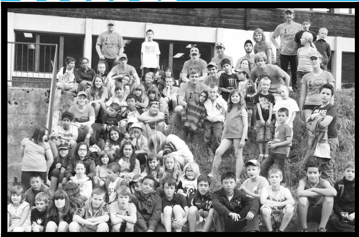
Participants et moniteurs de la colonie de Matran 2012