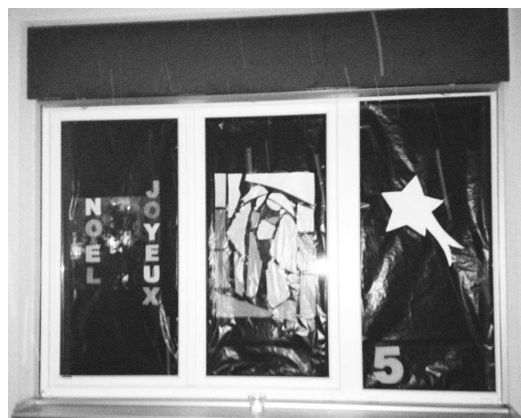
Décoration d'une fenêtre de Matran pour l'Avent