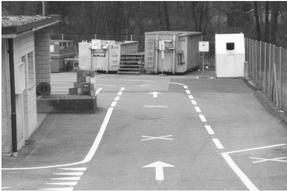
La déchetterie de Matran